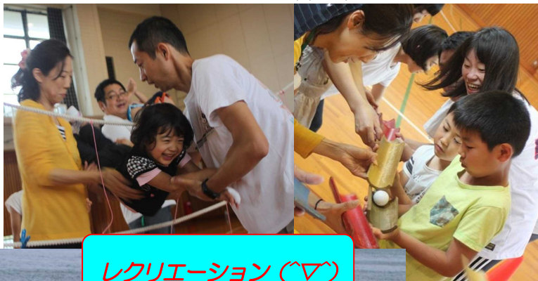
レクリエーション（▽）