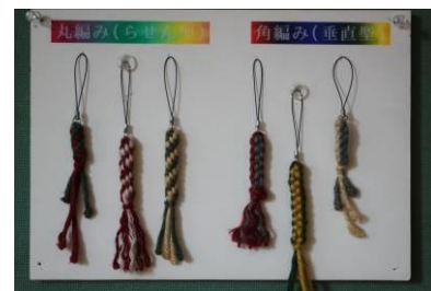
ロープストラップ