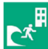
津波避難ビル・タワーを示すマーク

活動エリア内の焼津市指定津波避難ビル・津波避難タワーについては、各プログラムの地図または焼津市ホームページなどを参考とすること。